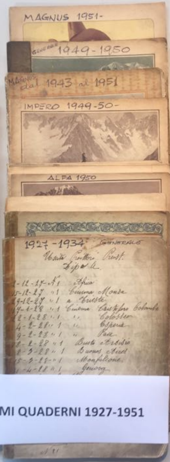
- I PRIMI QUADERNI 1927-1951